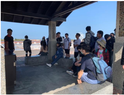
▲讓我們來分組，學習如何付出我們的力量，讓地球更美好