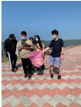
▲檢拾過垃圾後岸邊變得更乾淨