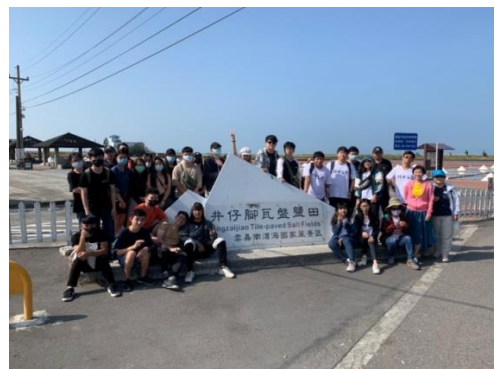
▲服務學習過後付出的心情是很美好的