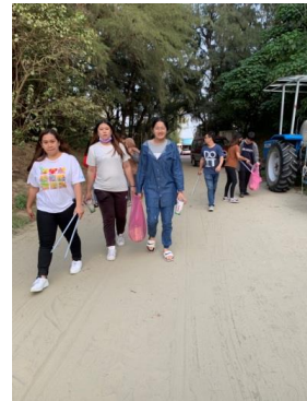
▲淨灘時也要認識海岸植物