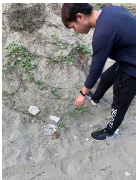
▲認真撿垃圾的男人最帥