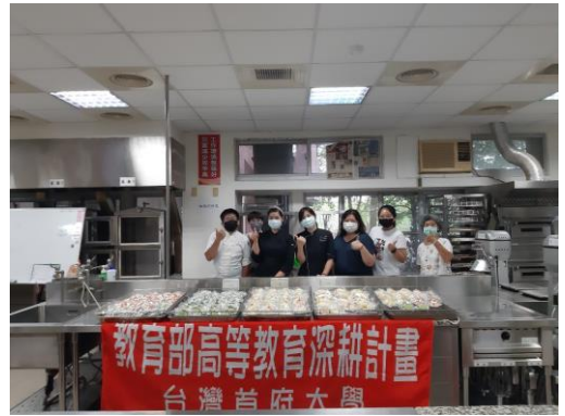
▲第一階段完成之大合照。