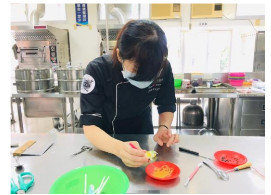
▲金魚-將背鰭、腹鰭、臀鰭及尾鰭塗上金粉。