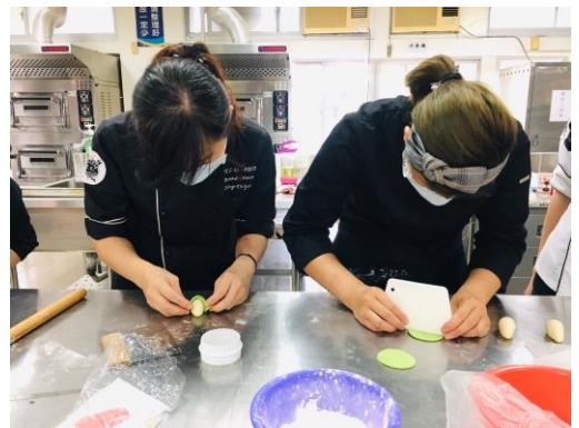
▲粽寶寶-製作蝴蝶結。