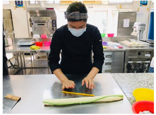
▲提折包-白麵糰與染色麵糰組合。