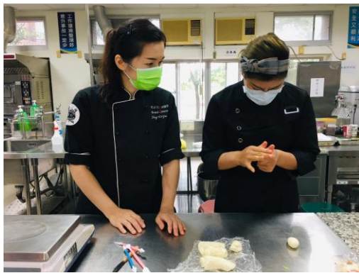
▲小豬-頭部及身體製作。