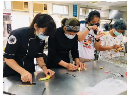
▲金魚整型-製作金魚眼睛。