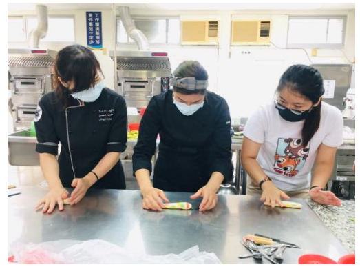
▲金魚-身體整型揉成水滴狀。