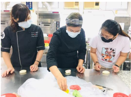
▲金魚-白麵糰與染色麵糰組合。