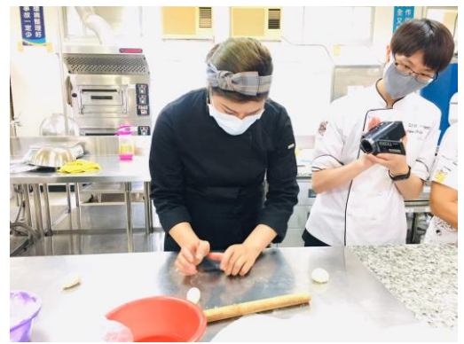
▲粽寶寶-麵糰擀成圓片狀包餡整成水滴狀。