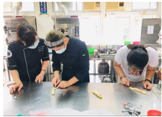
▲金魚整型-製作金魚尾巴。