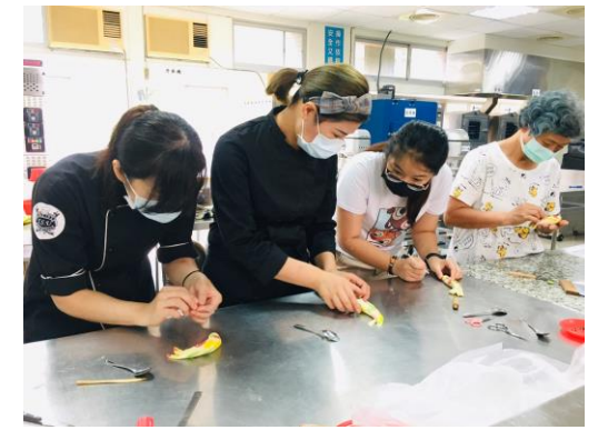
▲金魚整型-魚鱗製作。