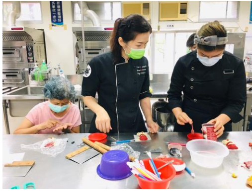
▲小豬-調紅色水擦指甲用。