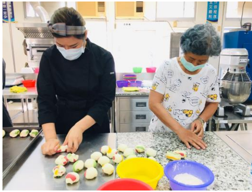
▲提折包-將顏色揉開呈渲染的感覺。