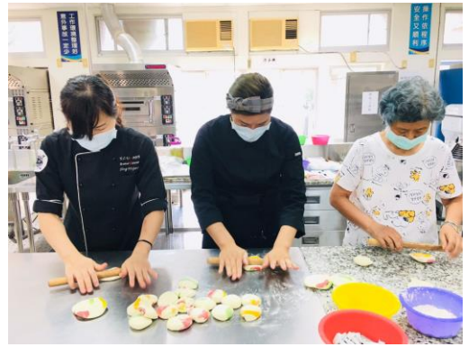
▲提折包-將麵糰擀成圓片狀。