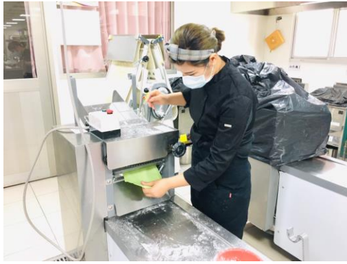
▲粽寶寶-葉子麵糰壓延。