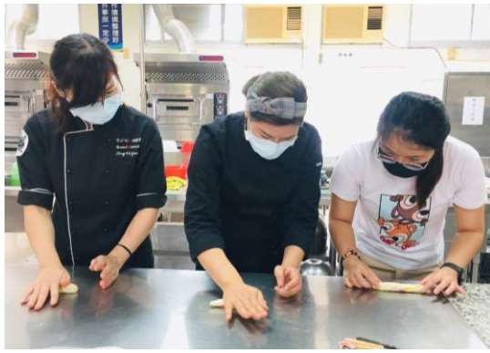
▲金魚-將顏色揉開呈渲染的感覺。