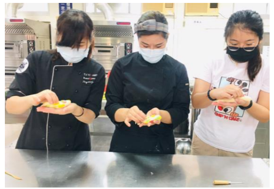
▲金魚整型-捏金魚背鰭。