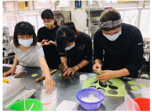
▲粽寶寶-葉子製作壓成圓片狀。